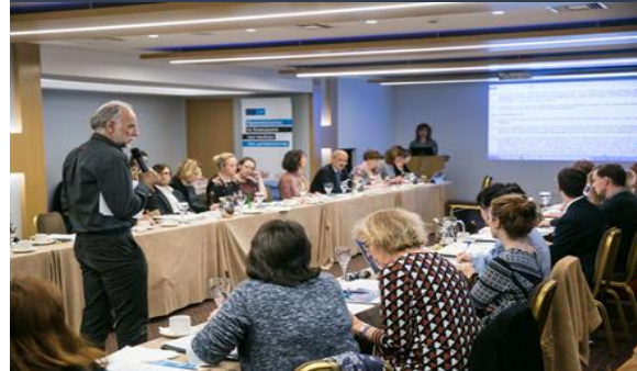
Συνάντηση με Ευρωπαίους Συνηγόρους, Νοέμβριος 2017